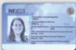
NEXUS 卡 (只适用于从加拿大机场入境)