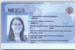
NEXUS 卡 (只适用于从加拿大机场入境)