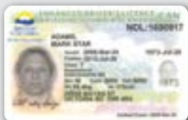
国家或省发行的加值驾驶执照