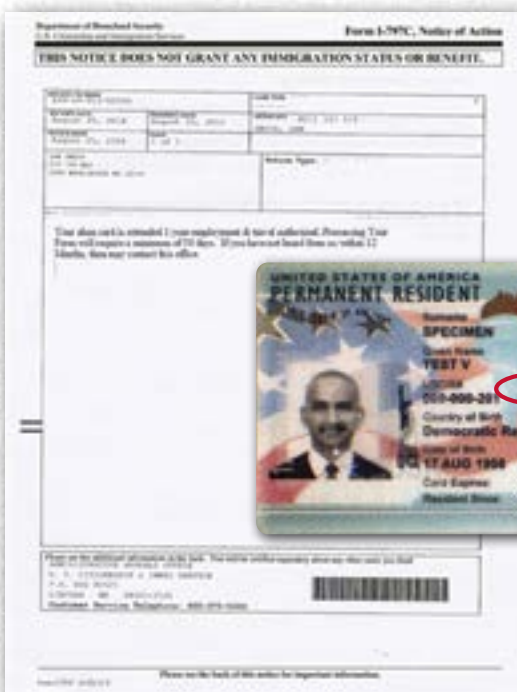
美国国土安全部 2017版本

当一个美国本土的居民持有过期的居民卡(两年有效),还持有行动通知(表格 I-797)时,可放行登机。该表格延长居民卡的有效期限至特定时间,一般是一年。表格的“收据日期”与卡片的有效日期没有任何关联。不需要护照。