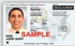
军事识别卡 (同时有官方旅行令)