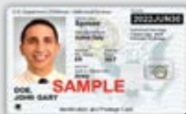
军事识别卡 (持有官方旅行令)