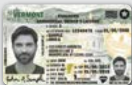
国家或省发行的加值驾驶执照